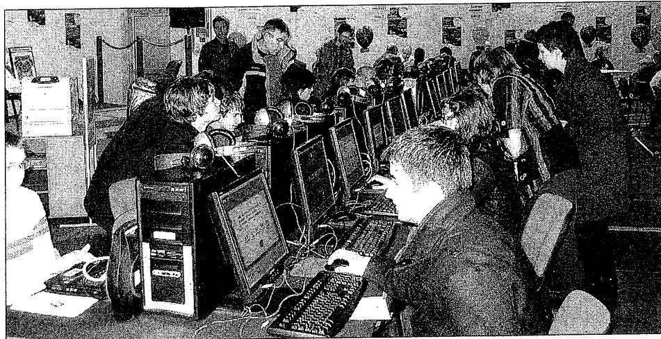
Pas moins de 400 visiteurs ont été comptabilisés vendredi pour la 2e nuit de l'orientation.

Plus de 27 professions sont représentées avec autant d'intervenants. Banque, assurances, l'armée, la mode, l'image, tous les corps de métiers se